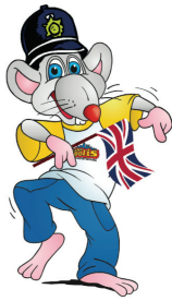
Foto3 Englisch Camp in Minopolis