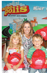
Foto 5 Minopolis Schulstartsackerl Aktion mit Kati Bellowitsch