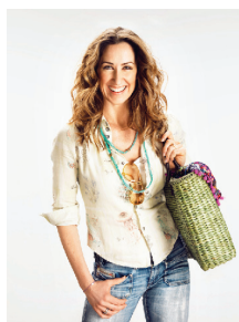
Foto1 Sommer in Minopolis

Fotonachweis © Minopolis, Abdruck honorarfrei!