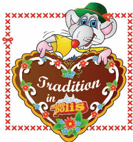
Tradition in Minopolis Foto 3