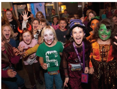
Halloween in Minopolis Foto 5